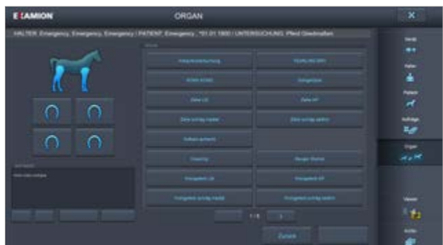
Individuell konfigurierbare Express-Buttons