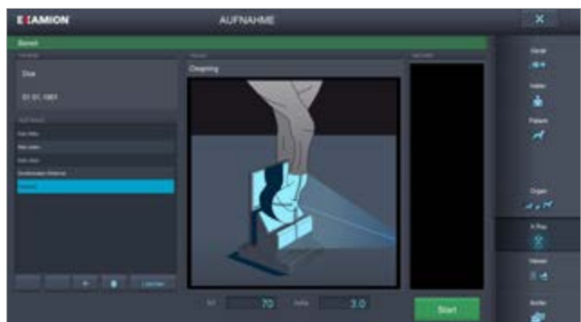
Speziell optimierter Workflow für die Aufnahmen am Pferd